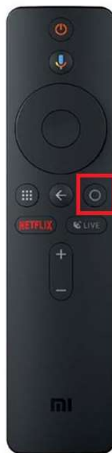
Escritorio del dispositivo